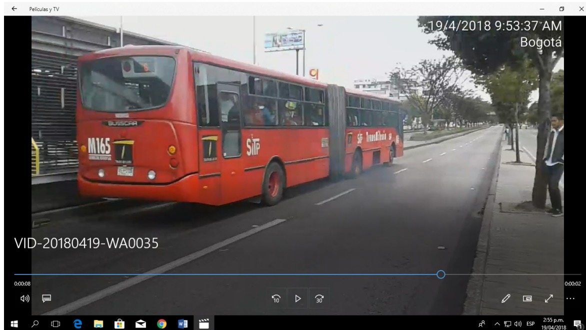
Imagen 1. (pluma contaminante generada por el vehículo de placa VEH215)